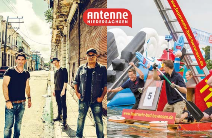
Das Antenne Niedersachsen-Wochenende am Nordufer:

11.8.: Marquess (Maschsee Bühne), 12.8.: Bahlsen Crazy Crossing (auf dem See)