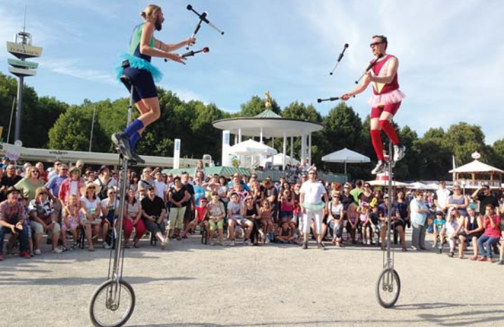
Opus Furore mit „Olympic Games“ 4.+5.8., Show am Anleger Stadion