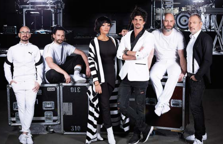
Munique · 1.8., Löwenbastion