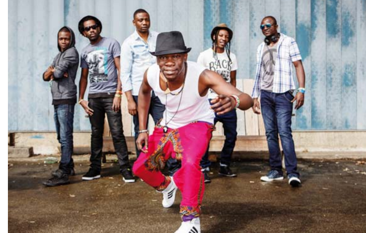
Mokoomba · 12.8., Maschsee Bühne

21.00 Uhr: DJ Svenny (Bereich „Mama Thres!“)