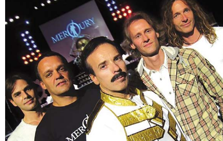
MerQury 10.8., Maschseequelle

18.30 Uhr: Wein-Abend mit einem Menü von und mit dem Weingut Dr. Heger